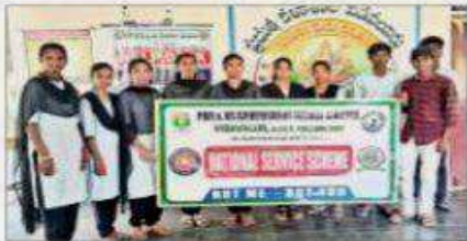
సేవా కార్యక్రమాలపై అవగాహన కల్పిస్తున్న విద్యార్థులు