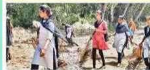
విడవలూరు కళాశాలలో చెత్తను తొలగిస్తున్న విద్యార్థులు

విడవలూరు: స్థానిక ప్రభుత్వ డిగ్రీ కళాశాలలో ఎన్ఎస్సీ డే ఘనంగా శనివారం నిర్వహించారు. ఈ సందర్భంగా ఎన్ఎస్సీ వాలంటీర్ల కళాశాల ఆవరణలోని చెత్తాదొరాలు తొలగించి శుభ్రం చేశారు. ప్రిన్సిపల్