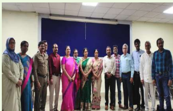
UGC HUMAN RESOURCE DEVELOPMENT CENTRE, ANDHRA UNIVERSITY VISAKHAPATNAM IDRC IN DISASTER MANAGEMENT (From 06-09-2022 to 19-09-2022)